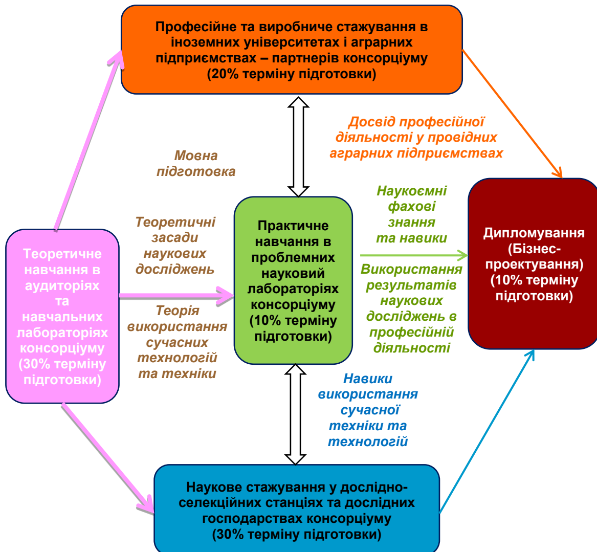
Рис. 2. Структура освітніх програм підготовки фахівців у консорціумі [розроблено авторами]

Діяльність консорціуму стала прикладом інноваційного розвитку не лише для інших навчальних закладів України, але й заклала базис для законодавчого закріплення даної організаційної форми кооперації наукових установ. Через рік після створення консорціуму Законом України "Про вищу освіту"[5], у 4-му розділі, ст. 27 визначено, що вищий навчальний заклад може бути засновником (співзасновником) інших юридичних осіб, які проводять свою діяльність відповідно до напрямів навчально-науково-виробничої, інноваційної діяльності, що він може утворювати навчальні, навчально-наукові та навчально-науково-виробничі комплекси, наукові парки та входити до складу консорціуму. Статтею 26 визначено, що основними завданнями вищого навчального закладу є: забезпечення органічного поєднання в освітньому процесі освітньої, наукової та інноваційної діяльності; створення необхідних умов для реалізації учасниками освітнього процесу їхніх здібностей і талантів та збереження та примноження моральних, культурних, наукових цінностей і досягнень суспільства.