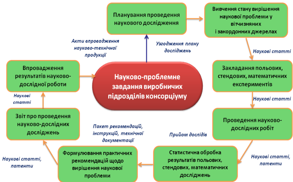
Рис. 3. Структурно-логічна схема проведення науково-дослідної роботи учасниками консорціуму [розроблено авторами]

Незважаючи на невеликий термін функціонування консорціуму, вже розроблено і впроваджено власну модель формування науково-дослідної діяльності всіх колективів консорціуму, яка чітко визначає наукову стратегію колективу, виконання наукових завдань його виробничих підрозділів. Етапи планування та реалізації науково-дослідних проектів у консорціумі представлені на рисунку 3.