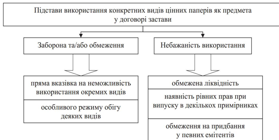
Рис. 2. Заборонені та/або обмежувальні підстави використання конкретних видів цінних паперів як предмета у договорі застави

Внаслідок наявності рівних прав, що впливають із переказних векселів, як одного з видів цінних паперів, випущених в кількох тотожних примірниках, які приймаються в заставу та не містять акцептованого примірника, можуть призвести до втрати заставодавцем частини майнових та/або інших прав, що впливають із векселя, якщо таке право буде здійснено раніше третьою особою.